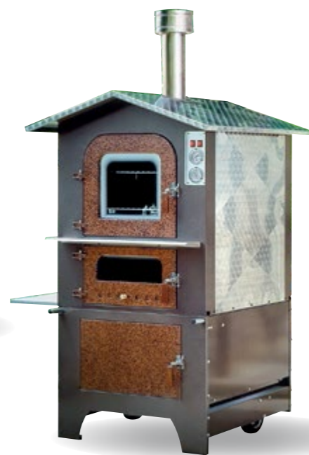
SATURNO KTS 80/100/125 INOX fiorettato