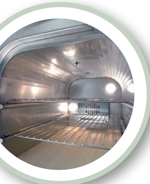
Particolare della camera di cottura. Detail of the cooking chamber. Kochraum.

Aufgrund seiner Dimensionen und Funktionalität ist es der meist angefragte Ofen der Linie Tranquilli, in der Zeit wurde dieser Ofen verbessert und verstärkt, eine Garantie für die die eine große Menge von Gerichten zubereiten wollen. Dies ist Dank der drei Kochebenen und dem Ventilationsystem machbar.