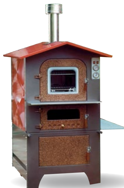
SATURNO KTS 80/100/125